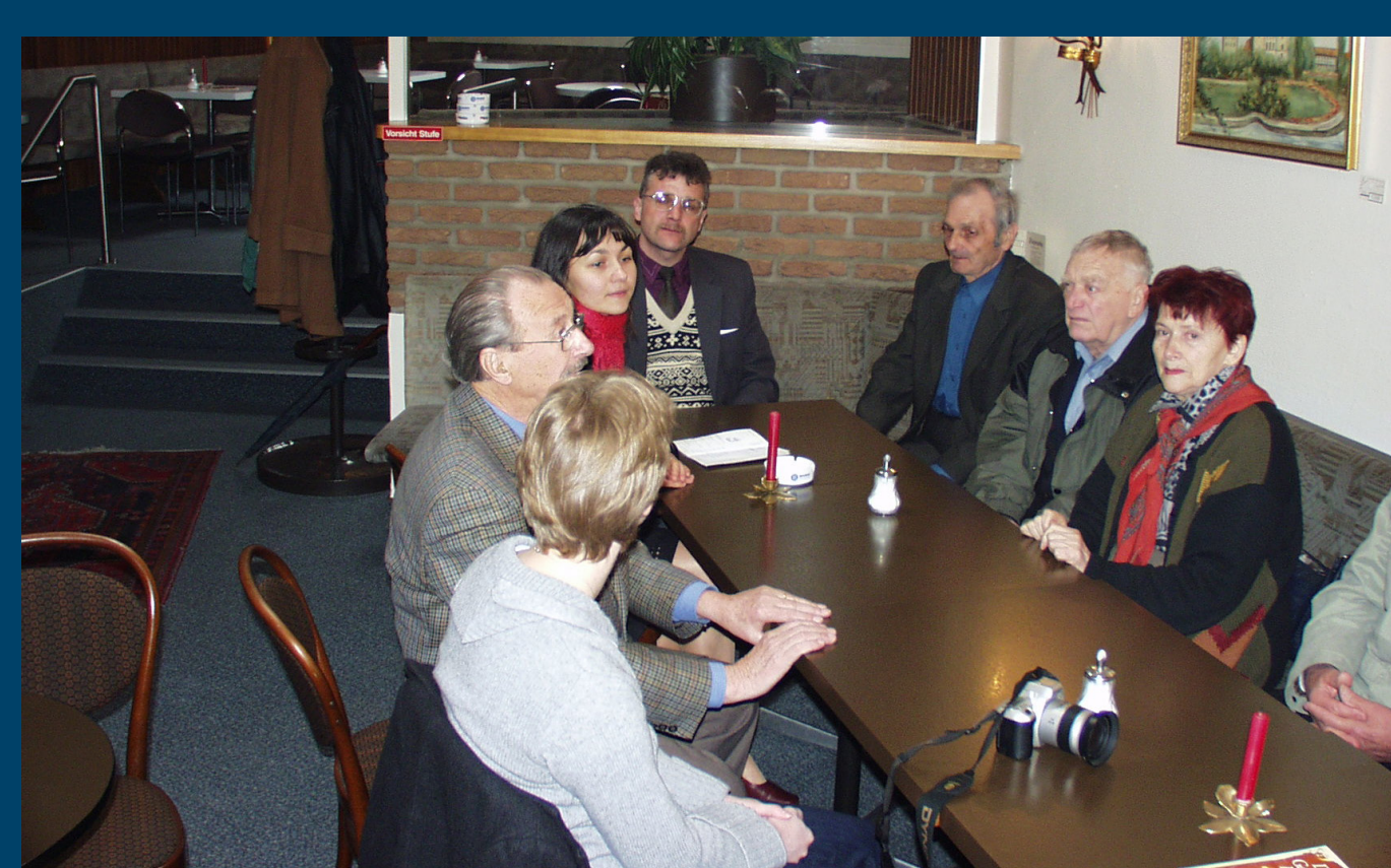
Nach dem Stadtrundgang besuchen die Überlebenden ein Restaurant.