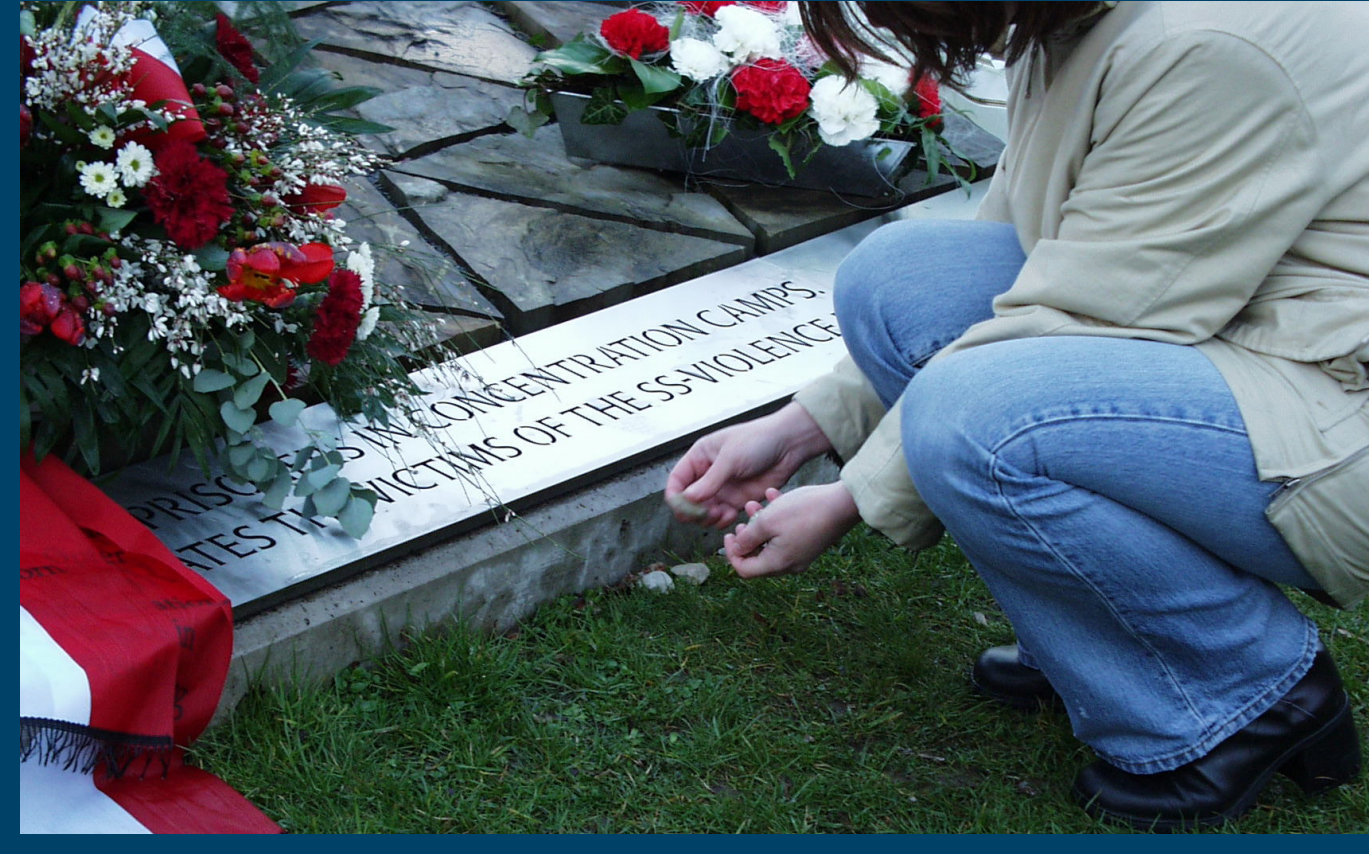
1.285 kleine Kieselsteine sollen an die Opfer des Konzentrationslagers erinnern.