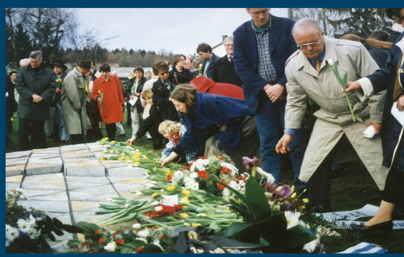
Niederlegung der Tulpen während der Gedenkfeier.