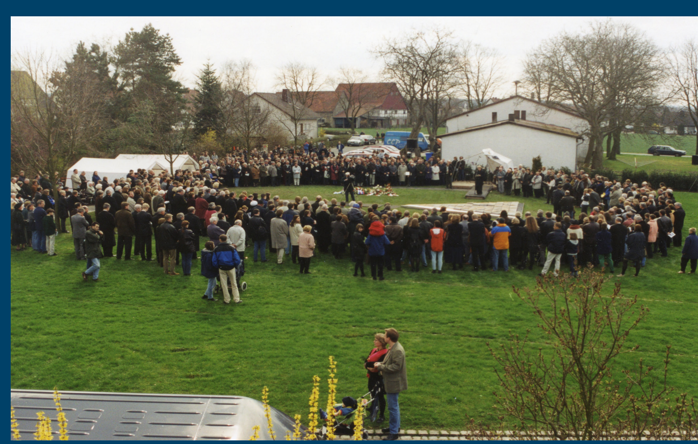
Foto von der Gedenkfeier, vom Balkon eines Nachbarhauses aus fotografiert.