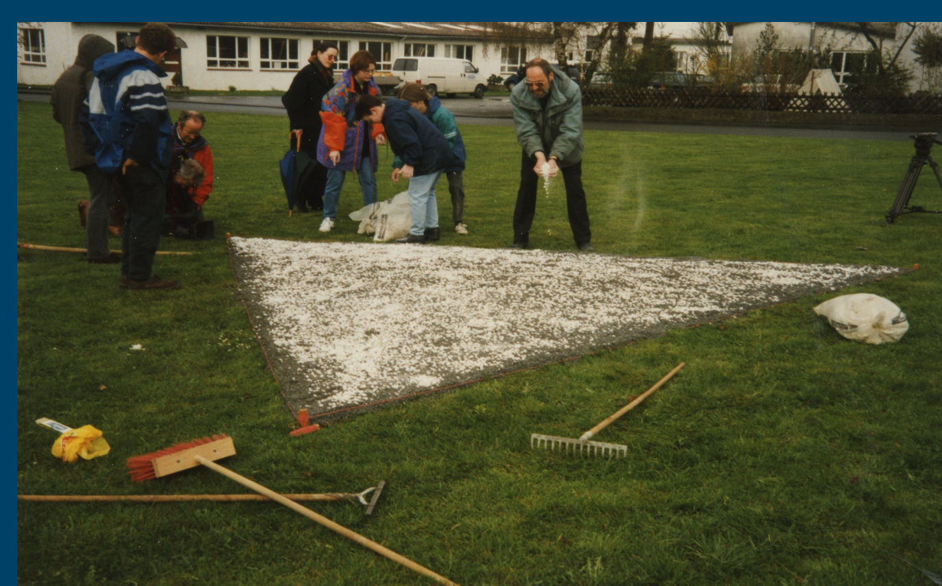
Mitglieder der Arbeitsgruppe „Gedenktag 2. April“ streuen das Kiesdreieck, auf dem später die Tulpen und der Kranz niedergelegt werden.