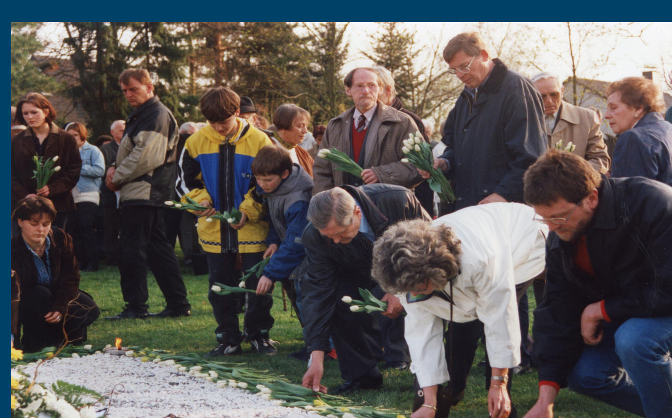
Während der Gedenkfeier werden 1.285 Tulpen auf dem Kiesdreieck niedergelegt.