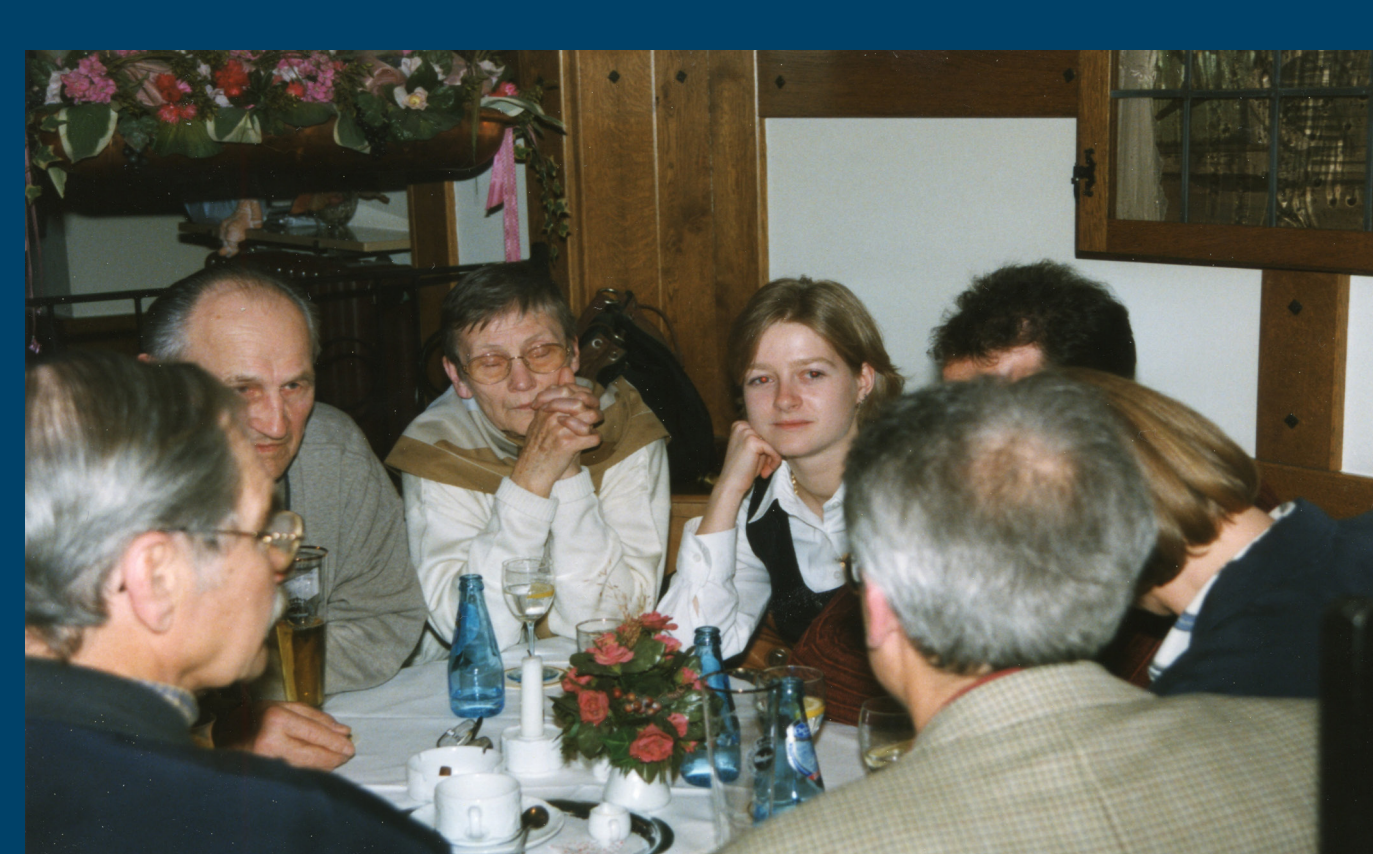
An den Abenden entwickeln sich spannende Gespräche zwischen den Gästen und den Jugendlichen.