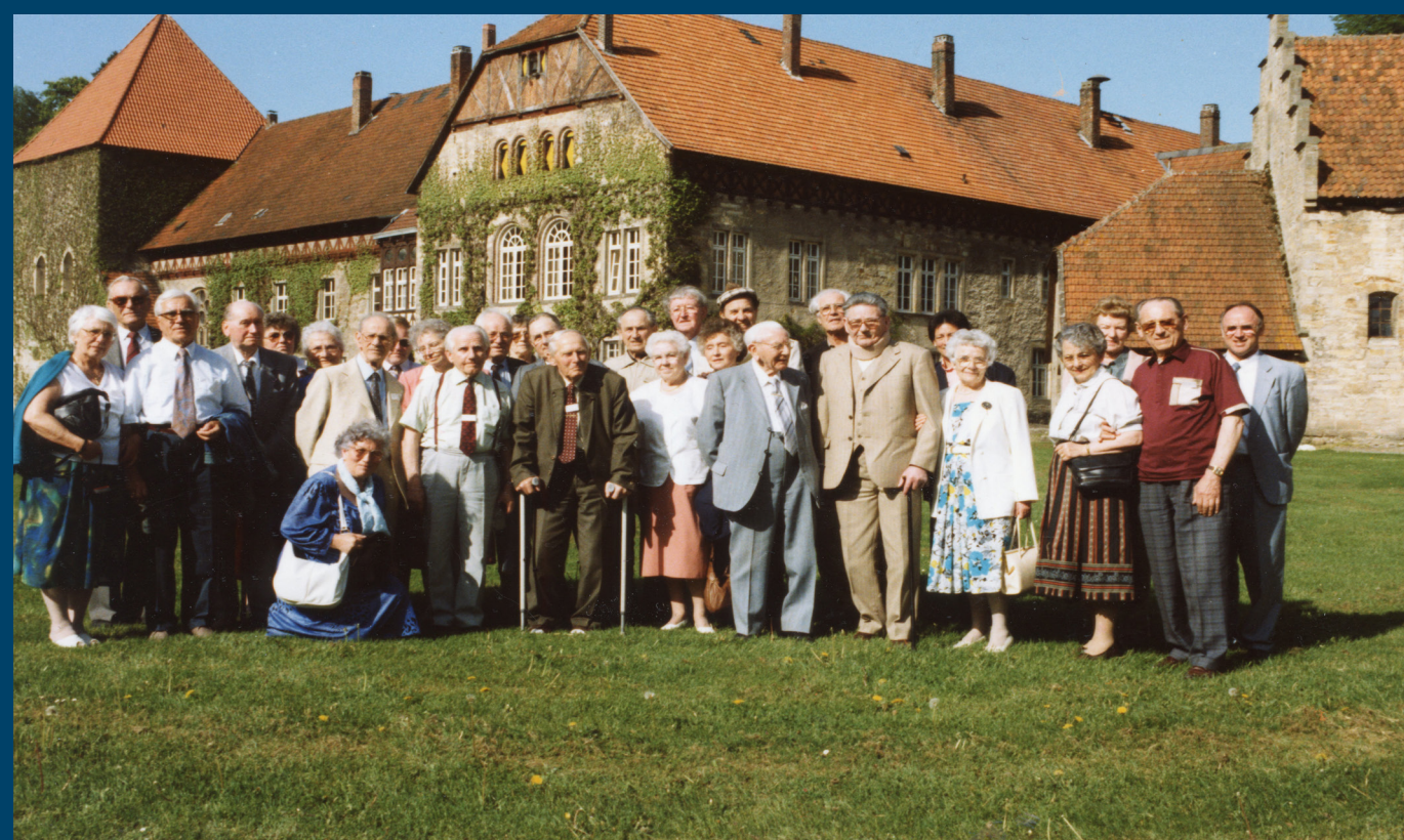
Bei einem gemeinsamen Ausflug zum Gut Böödeken entsteht dieses Gruppenfoto.