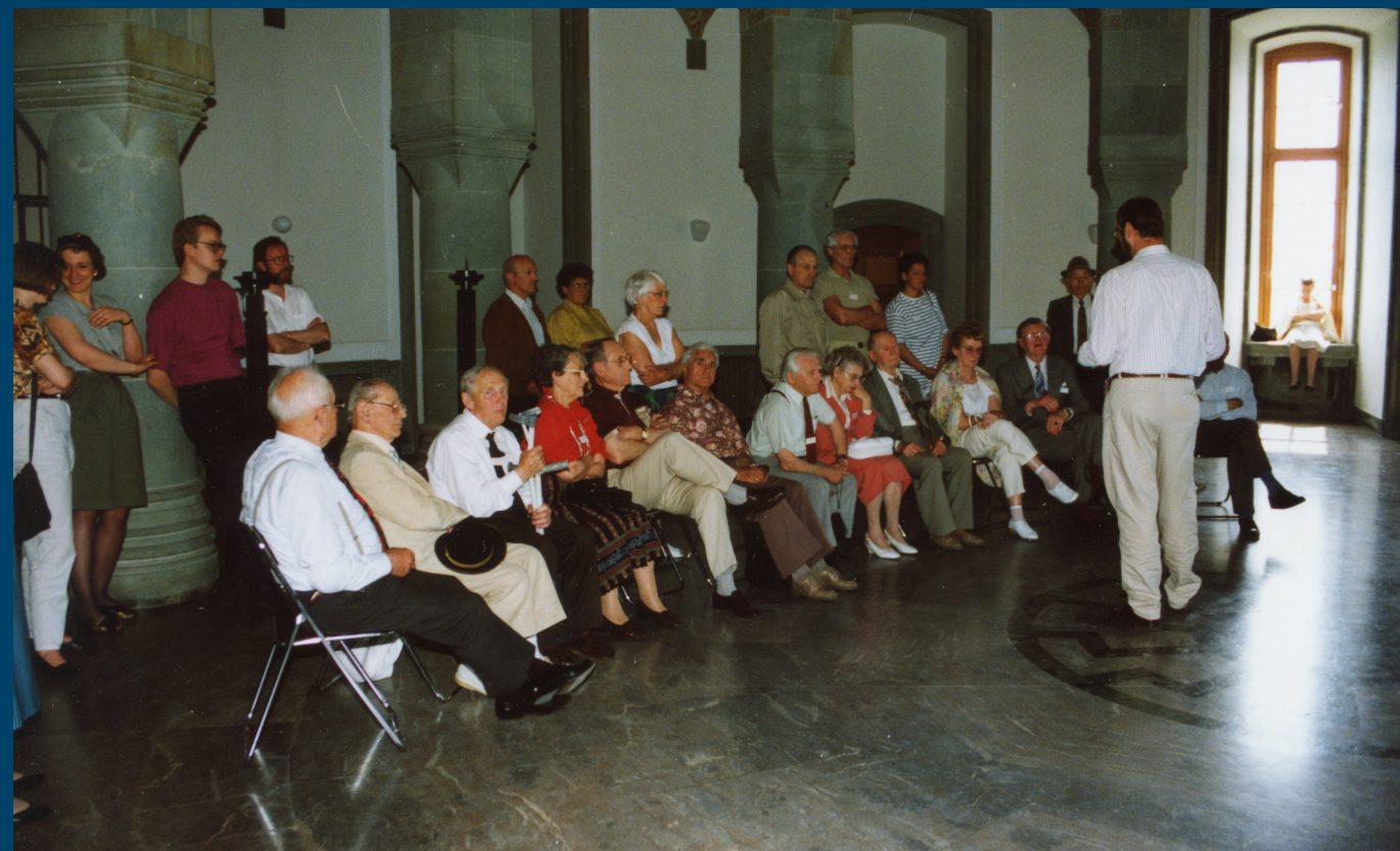
Im Rahmen des Rundgangs durch die Dokumentation wird auch der „Obergruppenführersaal“ besichtigt.