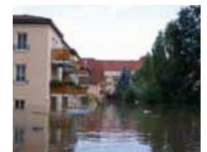
Hochwasser in der Stadt