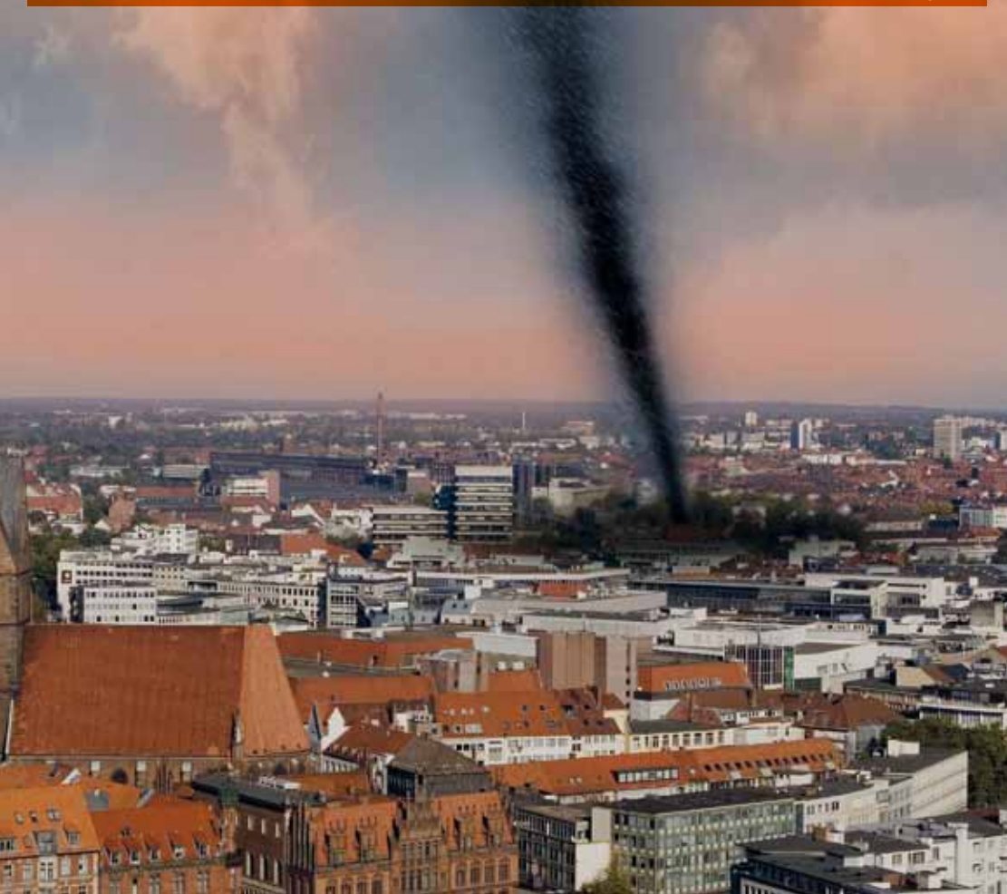
Von einem Tornado zerstörtes Wohngebiet in Quiria, Thüringen, 2006

So zerstörerisch könnte ein Tornado in der Großstadt sein. Bildmontage