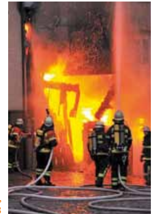
Hausbrand in Monschau, Nordrhein-Westfalen 2008