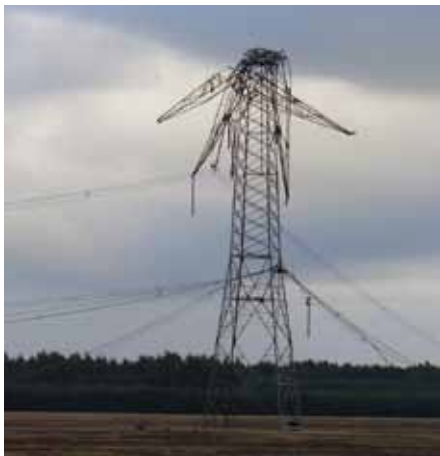
Sturmschaden durch den Orkan Kyrill im Jahr 2007