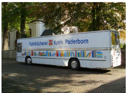
Der Bücherbus wie ihn jeder kennt.

Bitte beachten Sie bei EIS und SCHNEE, dass der Bücherbus nicht immer an der gewohnten Stelle halten kann, das gilt vor allem für Nebenstraßen und Siedlungen.